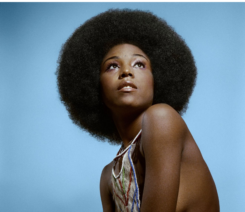
© Disco © Kwame Brathwaite – Untitled - 1970